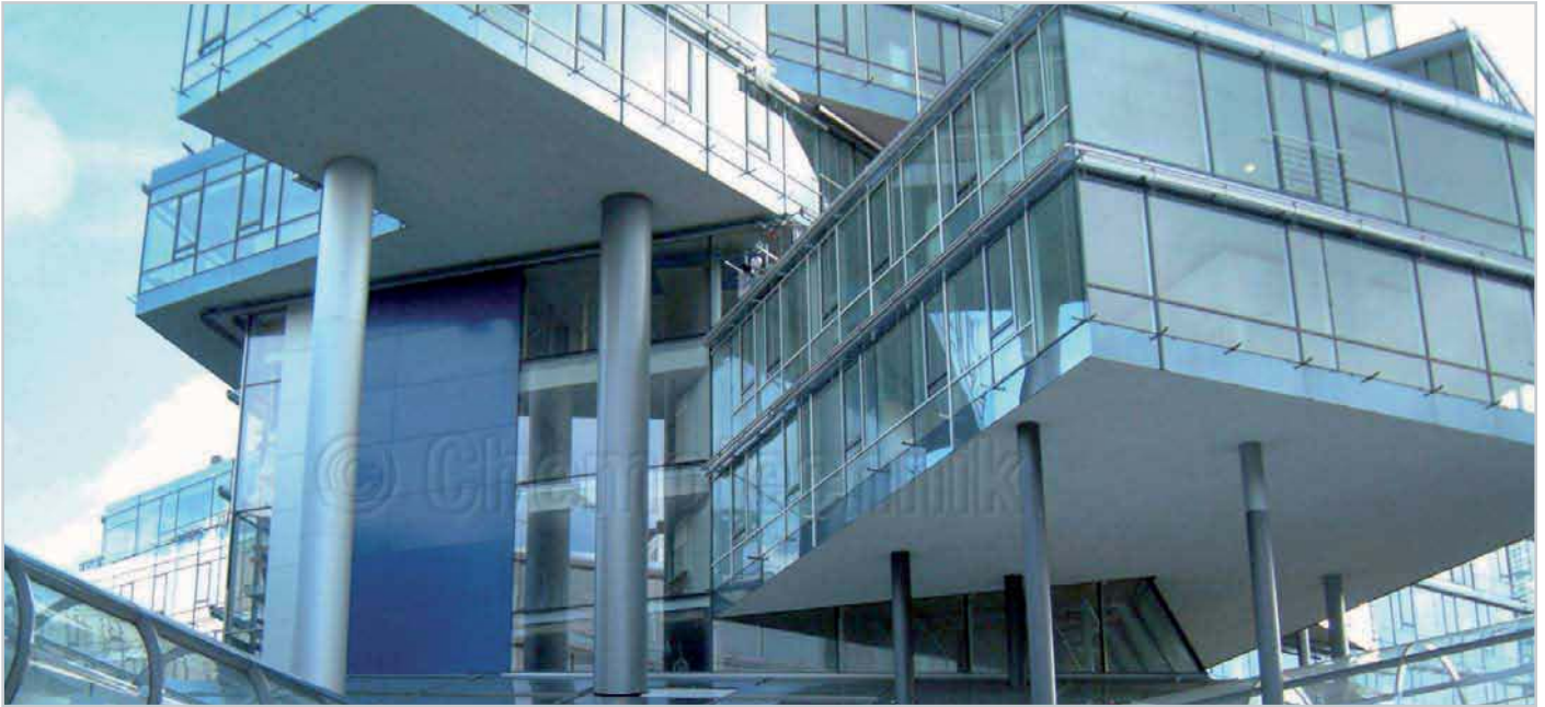
Landeszentralbank Hannover, Schwind- und spannungsfreier Estrich aus Thermorapid® Schnellzement

J a – durch eine nahezu endlose Zahl von Referenzen!