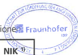
Tabelle 3: Zeitabhängige, chemisch-analytische Messwerte für die gemessenen Stoffkonzentrationen

Die erhaltenen Messergebnisse (Mittelwerte) sind in Tabelle 3 dargestellt.