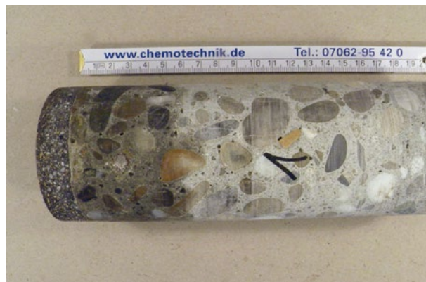
Stark verölter Beton unter Magnesiaestrich

Oftmals wurden Industrieböden über die Jahre mehrmals überarbeitet, sodass ein vielschichtiger Fußbodenaufbau vorzufinden ist. Mögliche labile Zwischenschichten sind in der Regel per Augenschein nicht erkennbar. Möglicherweise verfügt der Tragbeton unter der jetzigen Nuttschicht über eine zu geringe Festigkeit und Tragfähigkeit für die Aufnahme eines hochwertigsten Estrichs oder Belags und die vorgesehene Nutzung.